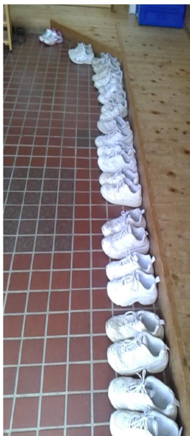
きちんとそろえられた靴。