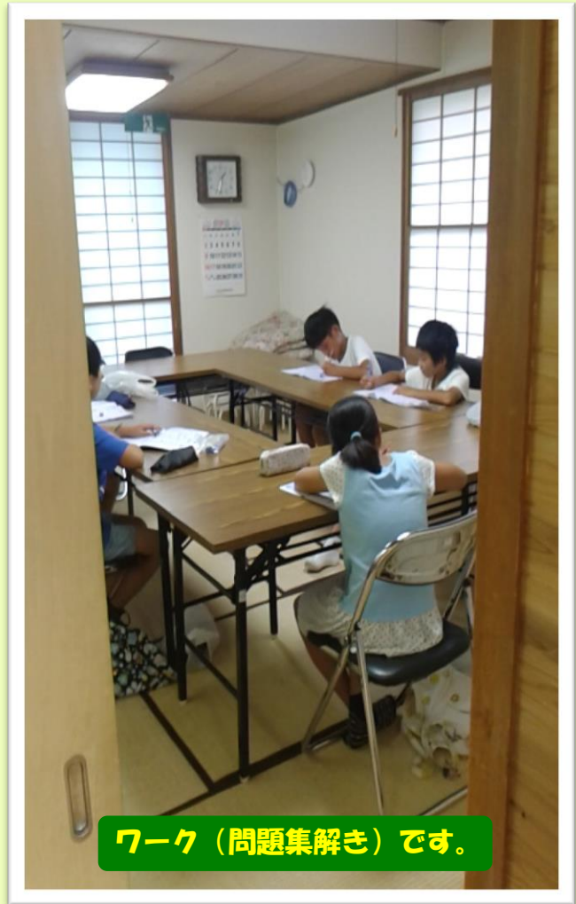
ワーク（問題集解き）です。