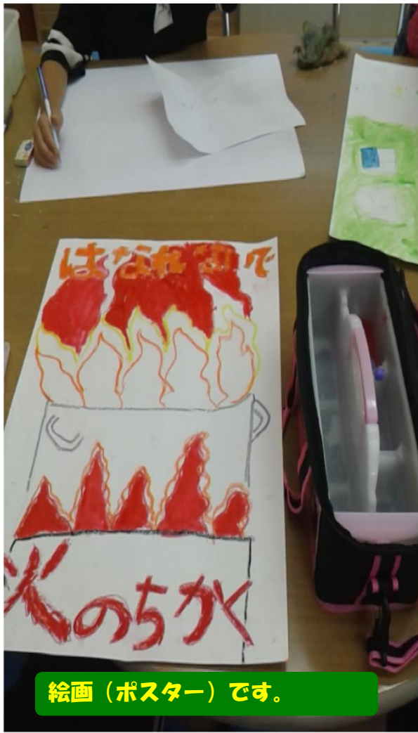
絵画（ポスター）です。