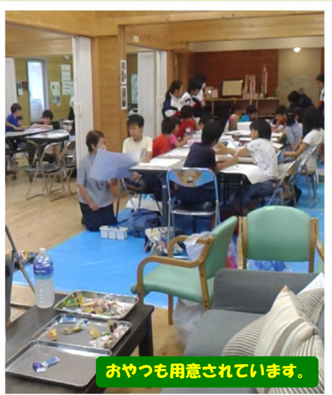
おやつも用意されています。