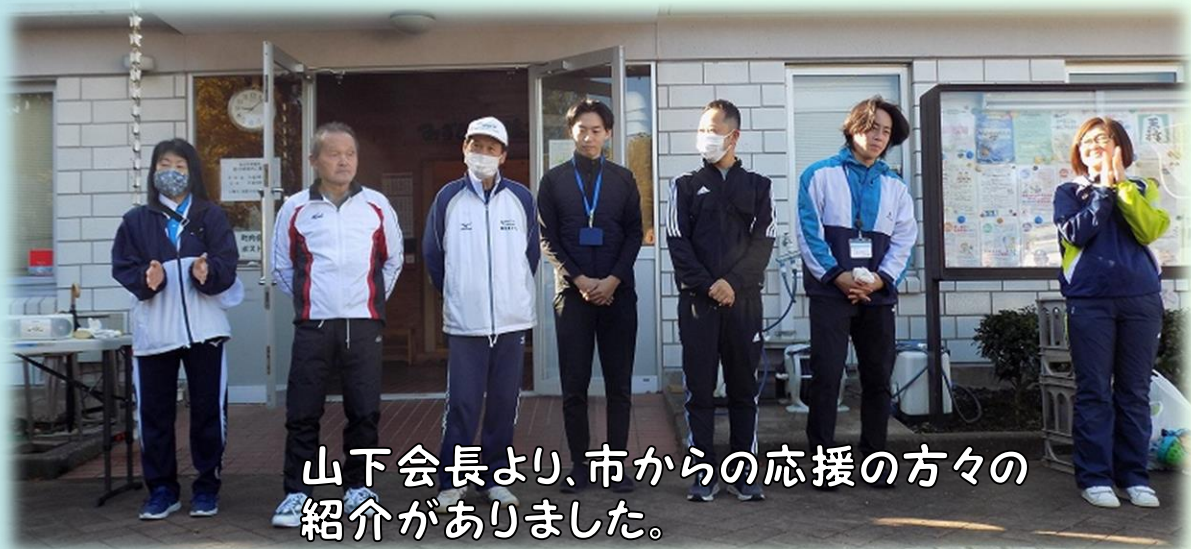
山下会長より、市からの応援の方々の紹介がありました。