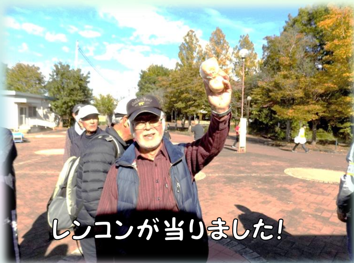
レンコンが当たりました!