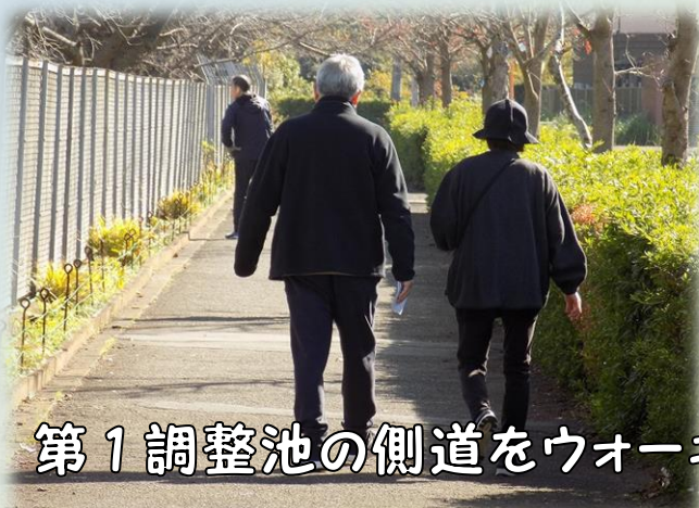
第1調整池の側道をウォーキング中