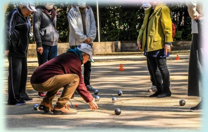
どちらが近いかわからないときは、メジャーで測ります