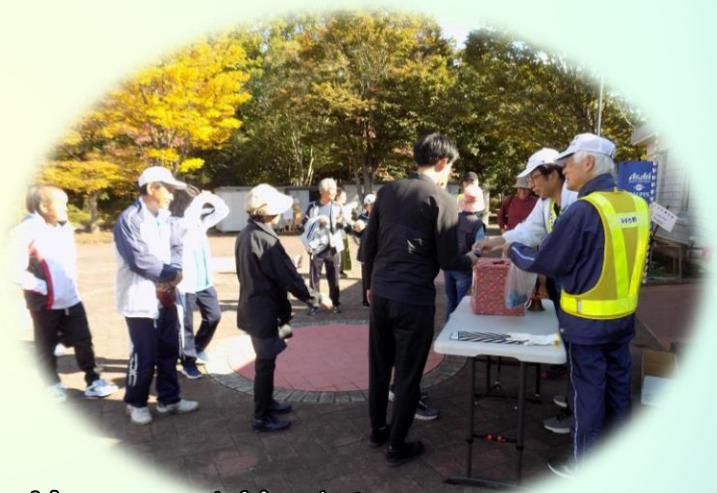
抽選会には大勢の人が並びました