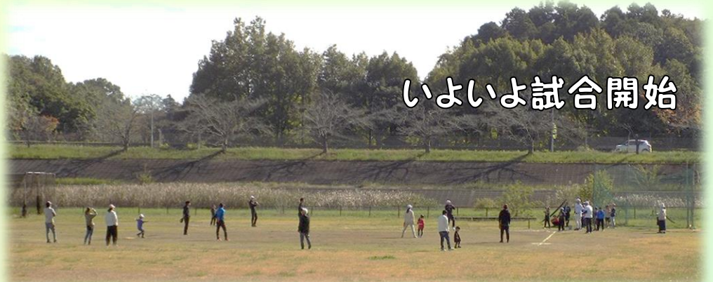
いよいよ試合開始