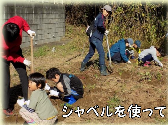
シャベルを使って