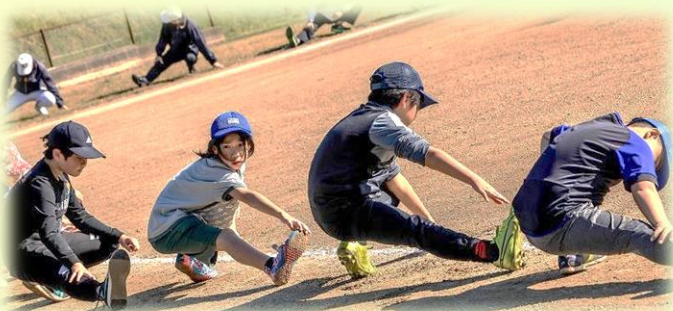
試合前の準備体操