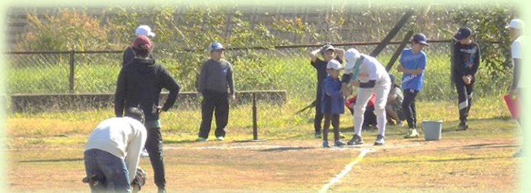
バットの持ち方を教えてもらう