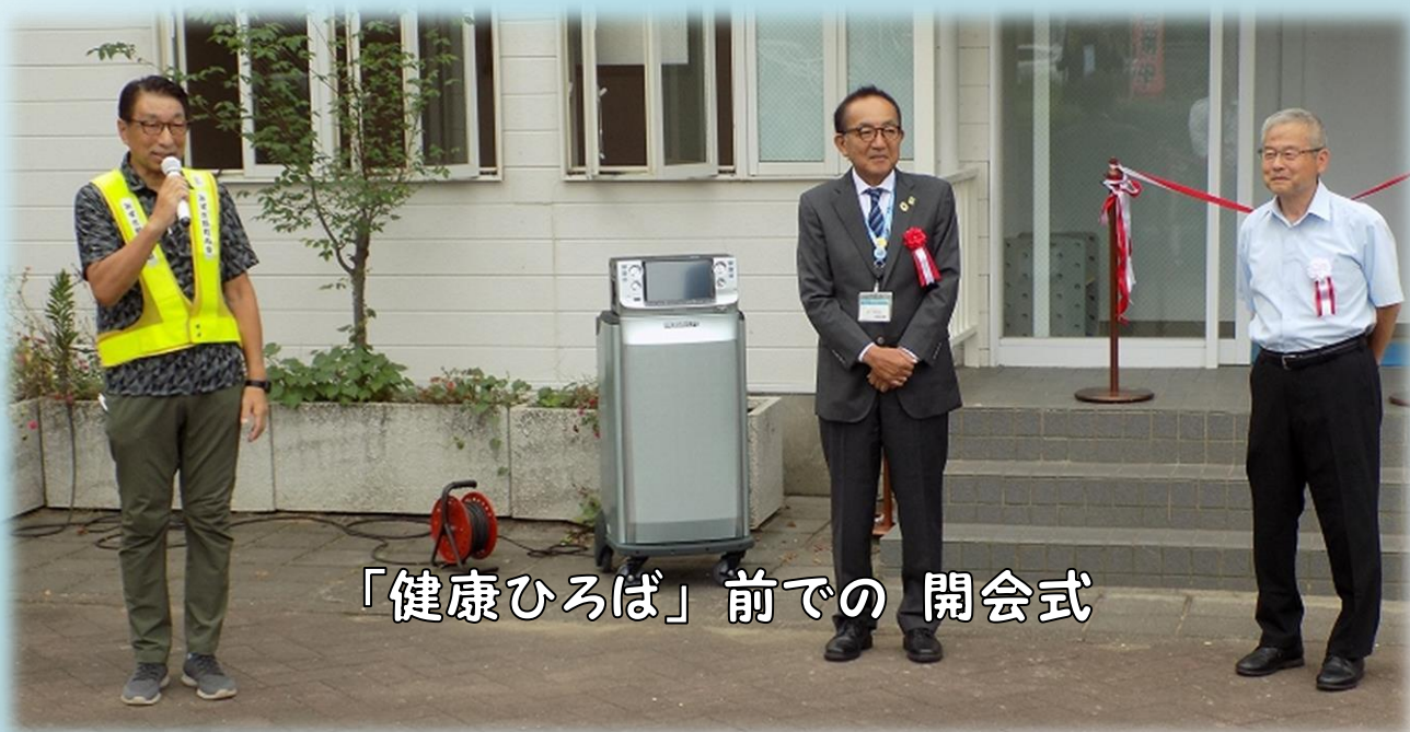
「健康ひろば」前での開会式

第一興商とタイアップしてカラオケや健康体操などの利用を検討しています。年内は機器の扱い方などを住民の皆さんに知ってもらうための説明会を予定しています。使用料金を含めて健康ひろばの利用規定を整備し、年明け1月から本格運用の予定です。