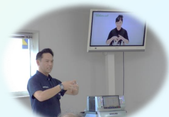
第一興商さんが、カラオケ以外に楽しめる指体操を説明