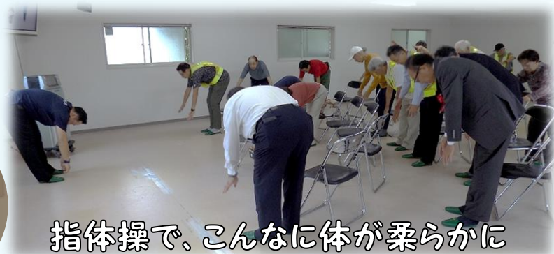
指体操で、こんなに体が柔らか