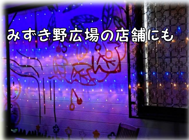
みずき野広場の店舗にも