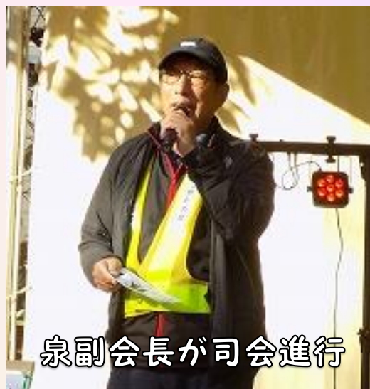
泉副会長が司会進行

演奏者の皆さんが、どんなに凄い人たちなのかを説明。生演奏を是非堪能してください。と挨拶。