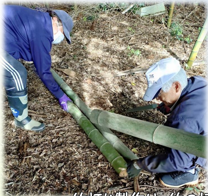
竹灯り製作は、竹の切り出しから始まります