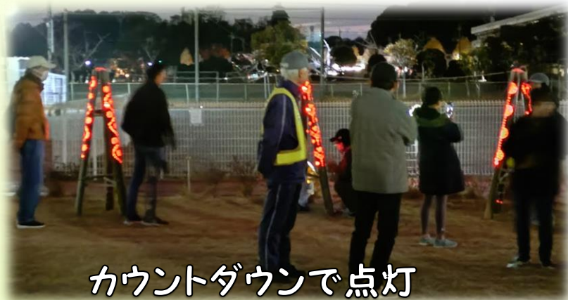
カウントダウンで点灯