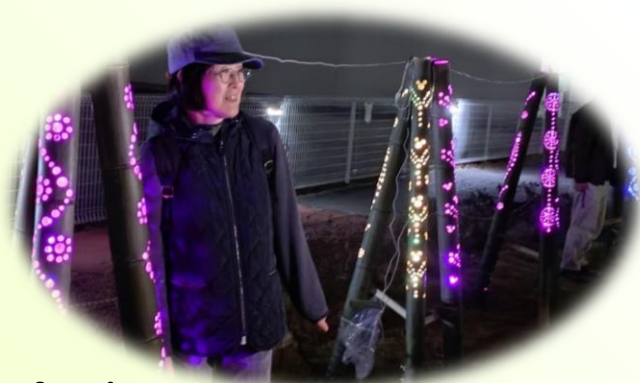
竹灯りが点灯して子供たちが大喜び!