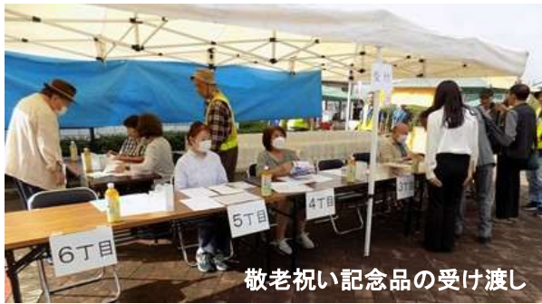
敬老祝い記念品の受け渡し

みずき野町内会・まちづくり協議会の新しい企画として【春を楽しむ会】に続き【秋を楽しむ会】が開催されました。前日の天気予報では曇り時々雨でしたが、当日の午前中は雲間から時折太陽が顔を出し気温も30℃近くまで上がり10月とは思えない気候となりました。