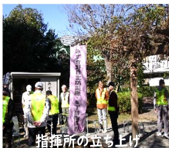
指揮所の立ち上げ