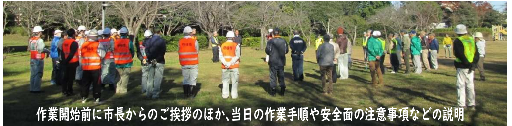
作業開始前に市長からのご挨拶のほか、当日の作業手順や安全面の注意事項などの説明

「さくらの杜公園」は日差しが差し込みすっきりした姿になりました。市役所職員の皆さん、町内ボランティアの皆さん、お疲れ様でした。(広報委員)