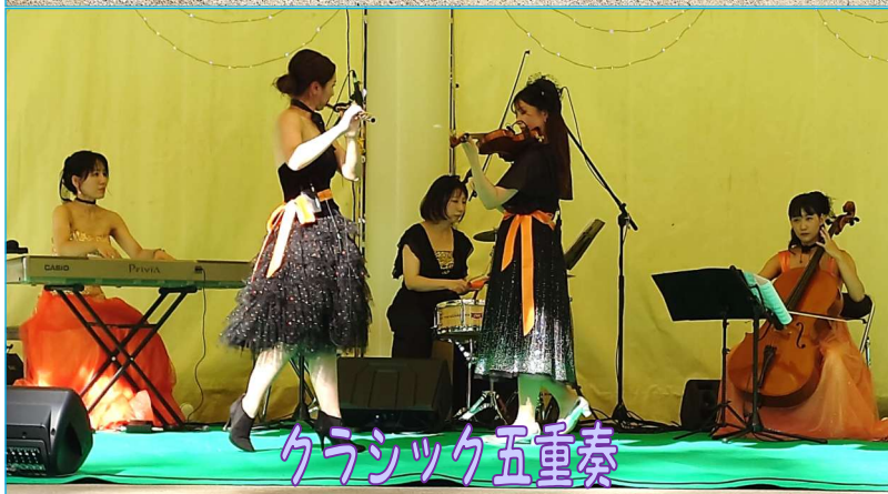
クラシック五重奏