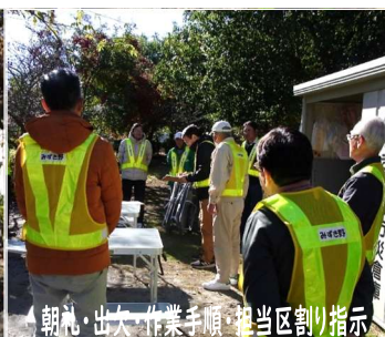
朝礼・出欠・作業手順・担当区割り指示