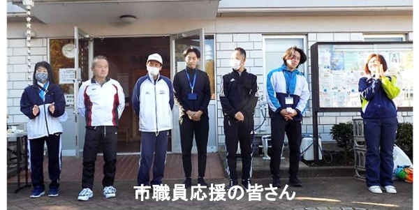
市職員応援の皆さん