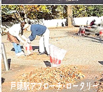
戸頭駅アプローチ・ロータリー