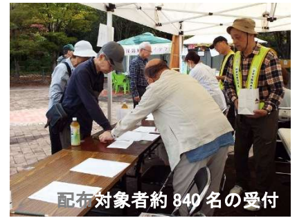
配布対象者約840名の受付

10時からは75歳以上の住民に敬老祝い記念品配布が集会所前で行われました。また、中央ステージでは同じく10時から4回にわたりプロコンサートが行われ多くの住民が集っていました。演奏が終わるたびに大きな拍手を送っていました。最後のアンコール曲が終わった途端に雨が落ち始め