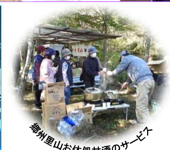
郷州里山お休処甘酒のサービス