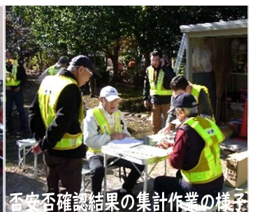
安否確認結果の集計作業の様子