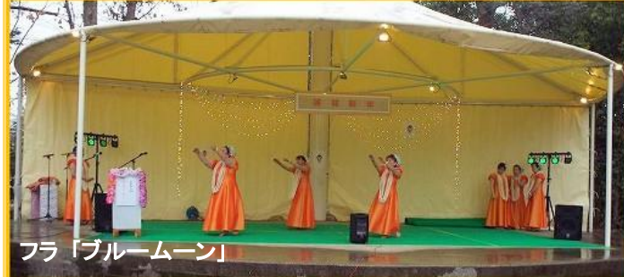
フラ「ブルームーン」