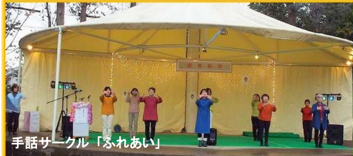
手話サークル「ふれあい」