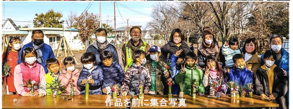
作品を前に集合写真