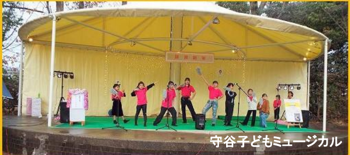
守谷子どもミュージカル