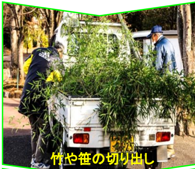
竹や笹の切り出し