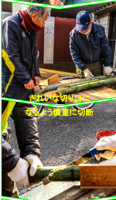
きれいな切り口に なるよう慎重に切断